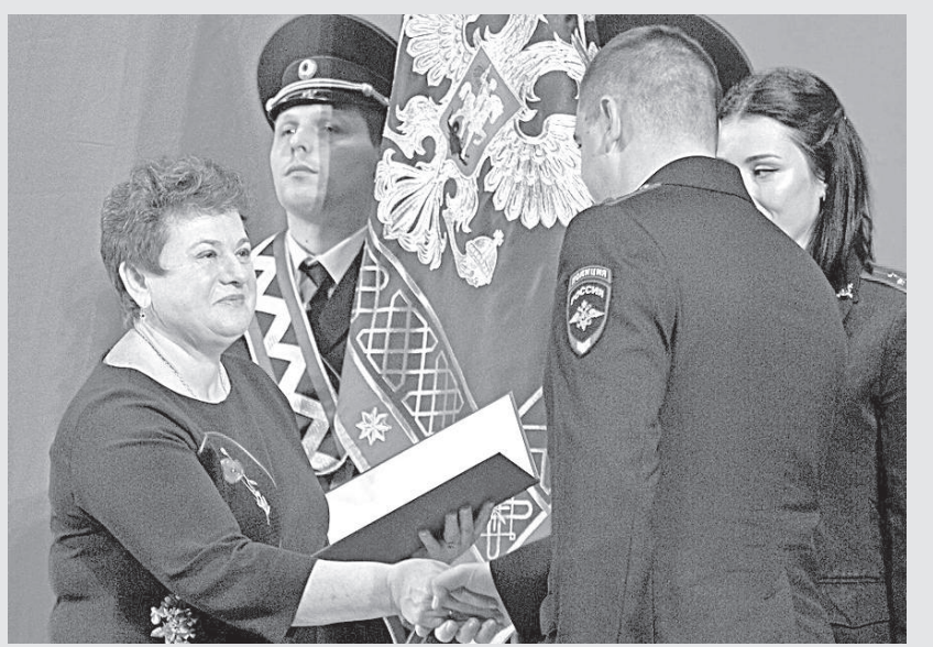
Во время награждения.

Губернатор предложила провести на базе Владимирско-Суздальского музея-заповедника съезд библиотечной России. «Мы всегда будем поддерживать библиотеки. Это важнейшие центры досуга, культуры, общения и обогащения знаниями», - подчеркнула членам Правительства РФ Светланой Орловой.